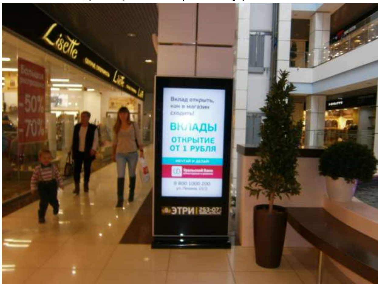
д. Стойка, размещённая на втором этаже у эскалатора