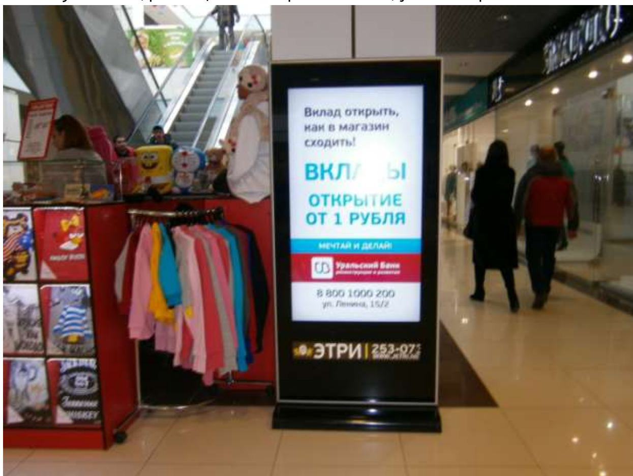
г. Стойка, размещённая на третьем этаже, у м-на Детский мир