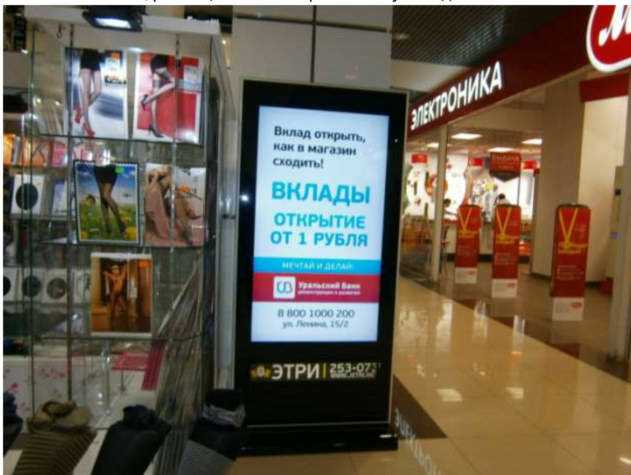
ф. Стойка, размещённая на третьем этаже, мягкая зона