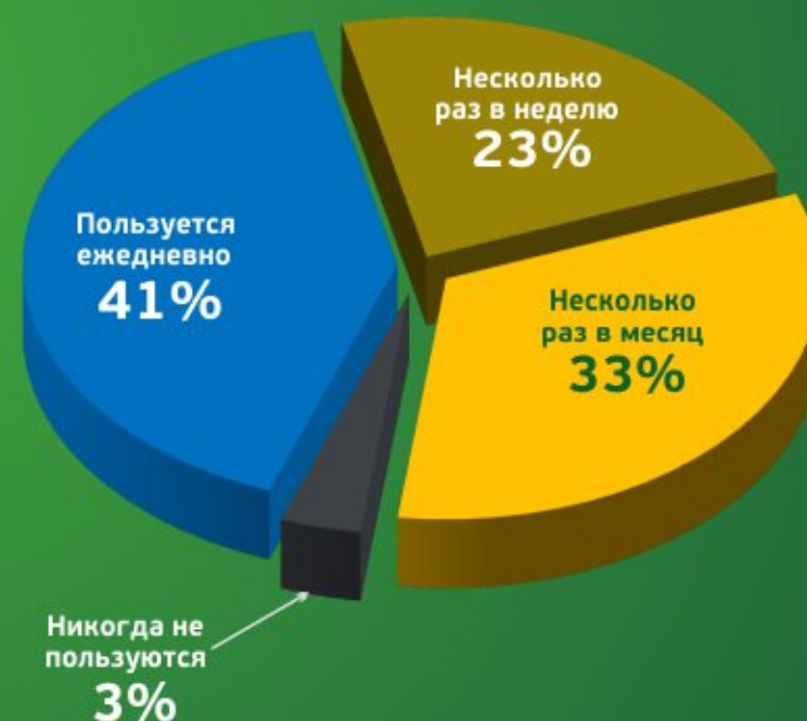
Общероссийская статистика использования общественного транспорта

Наша цена значительно ниже, чем у конкурентов предлагающих аналоги