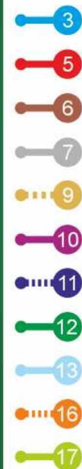
Схема маршрутов автобусного движения г. Нижневартовск